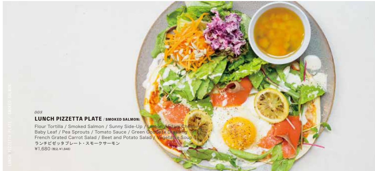
LUNCH PIZZETTA PLATE / SMOKED SALMON

Fresh Spaghetti / Arrabbiata Tomato Sauce / Prosciutto / Pork Black Olives / Cottage Cheese / Roasted Bread Crumbs French Grated Carrot Salad / Beet and Potato Salad / Vegetable Soup ランチパスタプレート・プロシュートとトマト ¥1,580 (税込 ¥1,738)