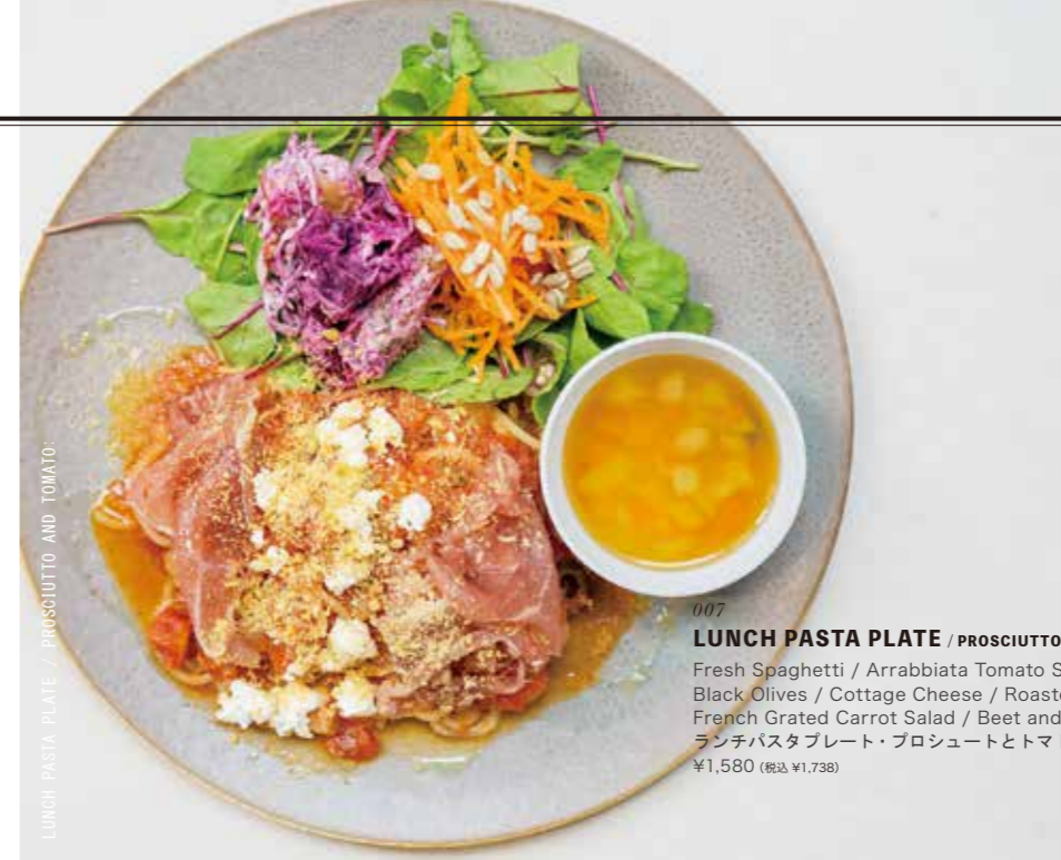
LUNCH PASTA PLATE / PROSCIUTTO AND TOMATO