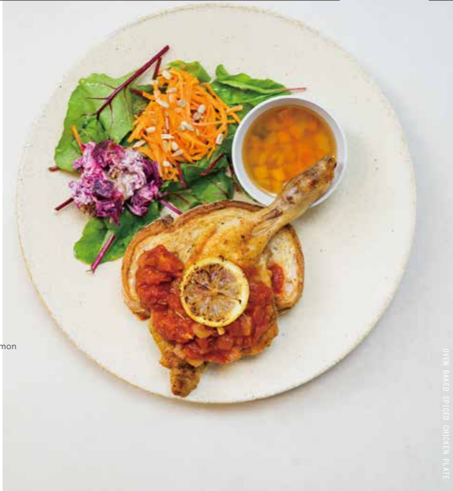
OVEN BAKED SPICED CHICKEN PLATE