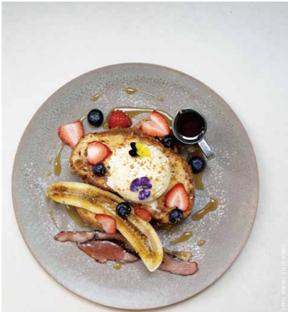
LUNCH STYLE FRENCH TOAST