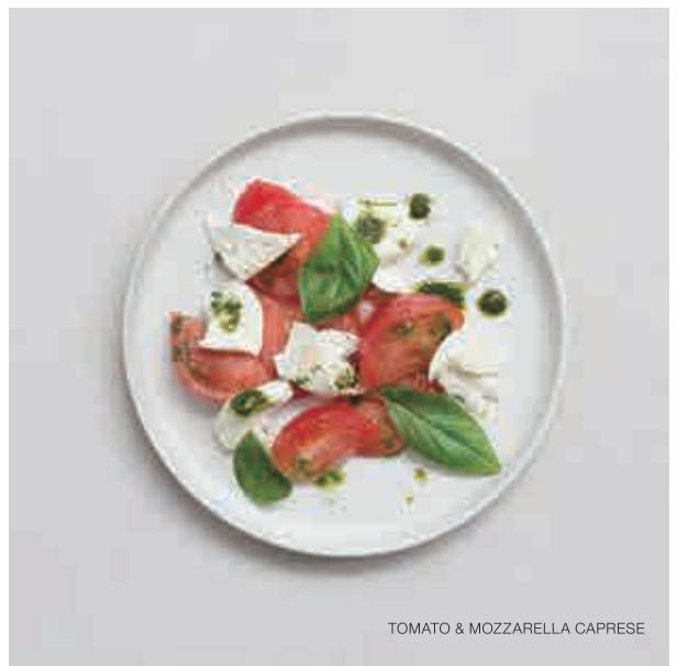
TOMATO & MOZZARELLA CAPRESE