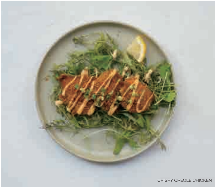
CRISPY CREOLE CHICKEN