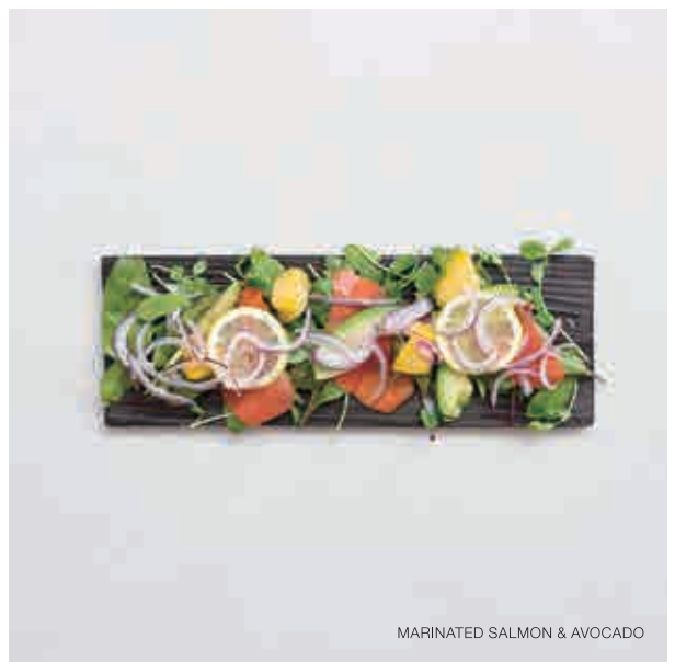
MARINATED SALMON & AVOCADO