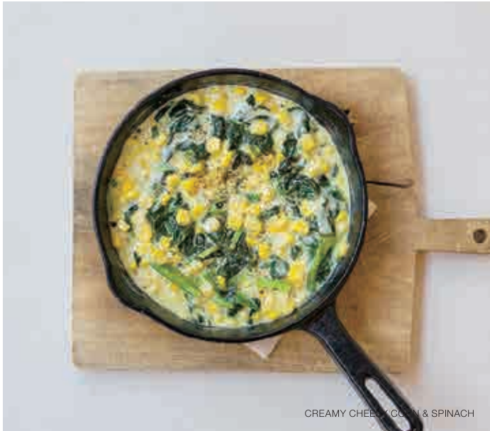
CREAMY CHEESY CORN & SPINACH