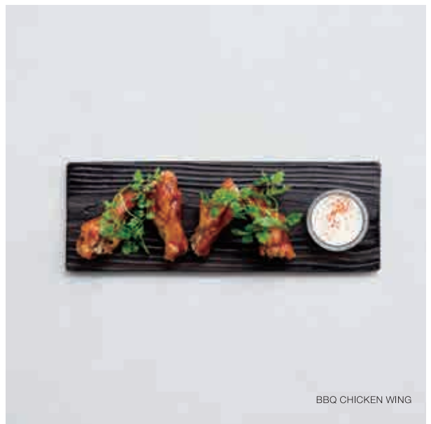
BBQ CHICKEN WING