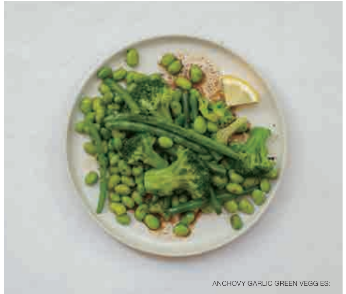
ANCHOVY GARLIC GREEN VEGGIES: